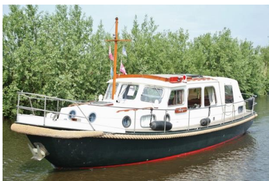
'Allegro', Gillissen vlet 10.30 OK/AK, bj. 1979 bij Venema / VEHA

We have dreamed since years to buy a yacht and cruise with it for a longer period of time. Our planning was to start our journey in spring 2021. In the last years we have tried to figure out what kind of yacht we should buy. First we were thinking of sailing the open seas with a sailing yacht, but we changed our ideas to cruising rivers, lakes and coastal areas with a motor yacht. Culture and nature were aspects we included in our considerations.