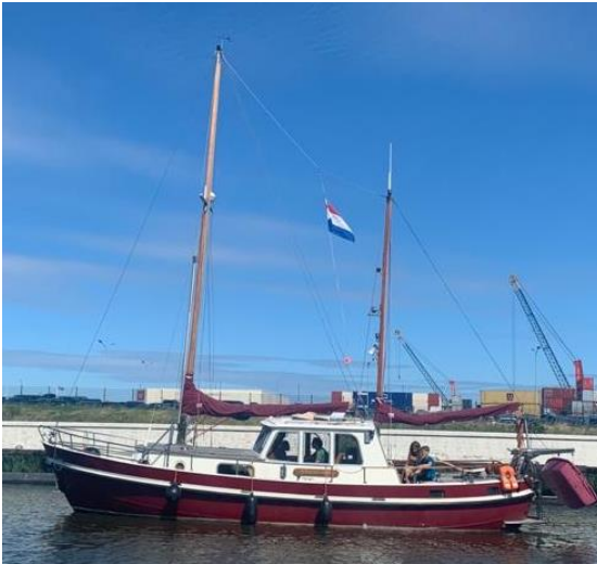
'Vagebond III', Gillissen motorzeilkotter 11.40 type Skipper, bj. 1978 bij Jacht- en Scheepswerf Akerboom in Bergum