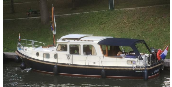
'Bengel V', Gillissen vlet 10.50, bj 1978 bij Venema Harkstede