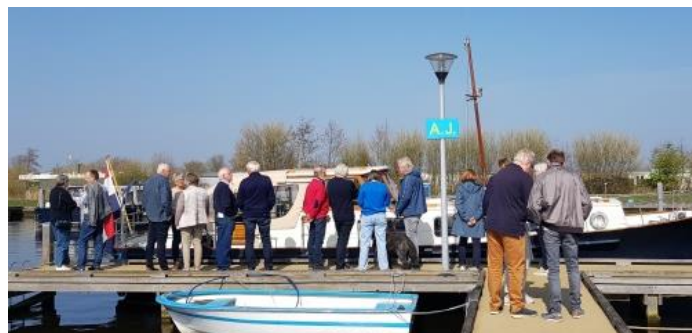
De 12.00 m. Gillissen Stevenvlet 'Havfruen' (bj 1964) in Uitgeest met belangstellende Gillissenvaarders