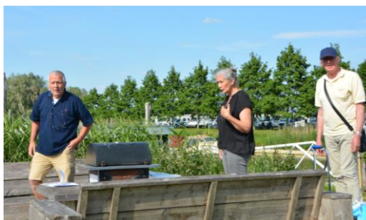
Het huidige bestuur van de Gillissenvaarders

Na 2 jaren geen Pinksterevenement te hebben georganiseerd door de corona, kon het nu, 2022, weer wel. En wat hebben we genoten die dagen, 3, 4 en 5 juni, daar in Hattem. Een mooie jachthaven (IJsseldelta Marina) een schitterend stadje met een mooie rondleiding, lekker eten, een hapje en een drankje en mooi weer. In totaal deden 21 schepen mee dat weekend. Een mooi verslag en diverse foto's kunt u vinden op onze website.