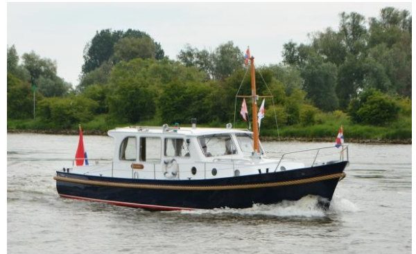
'Johanna', Gillissen waaiersteven 10.65, bj. 1968 bij werf De Hoop in Leiden