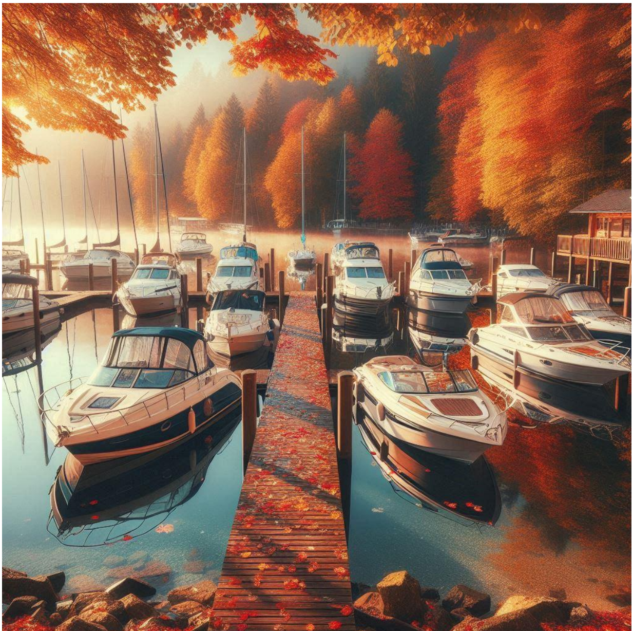
Afbeelding AI gegenereerd